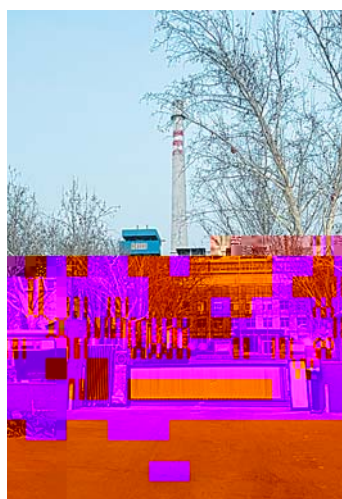
今年3月16日的明湖热电厂。料片